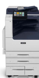
Impressora multifuncional a cores Xerox® VersaLink® C7120/C7125/ C7130