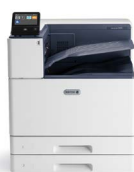
Impressora a Cores Xerox® VersaLink® C8000