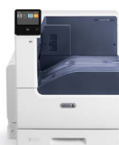
Impressora a Cores Xerox® VersaLink® C7000