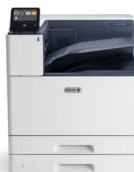
Impressora a Cores Xerox® VersaLink® C9000