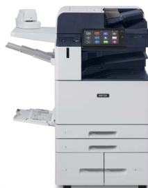
Impressora multifuncional a cores Xerox® AltaLink® C8130/C8135/ C8145/C8155/ C8170