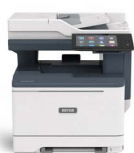
Impressora Multifuncional a Cores Xerox® VersaLink® C415