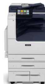
Impressora multifuncional Xerox® VersaLink® B7125/B7130/ B7135