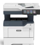
Xerox® VersaLink® B415 multifunktions skrivare