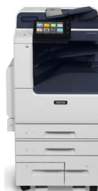
Xerox® VersaLink® B7125/B7130/ B7135 multifunk- tions skrivare