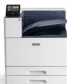
Xerox® VersaLink® C9000 färgskrivare