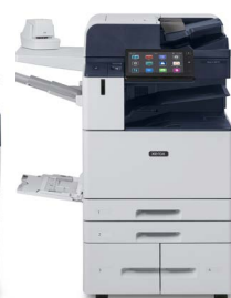
Xerox® AltaLink® B8145/B8155/B8170 multifunktions skrivare

* Produkten är inte tillgänglig i alla geografiska områden, vänligen rådfråga din säljare.