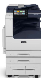
Xerox® VersaLink® C7120/C7125/ C7130 multifunk- tionsfärgskrivare