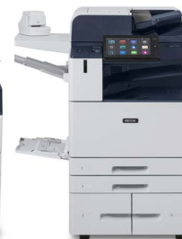
Drukarka wielofunkcyjna Xerox® AltaLink® B8145/B8155/B8170

* Produkt jest niedostępny w niektórych lokalizacjach. Skontaktuj się ze sprzedawcą, aby dowiedzieć się więcej.