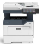
Drukarka wielofunkcyjna Xerox® VersaLink® B415