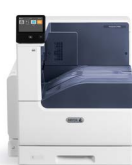
Drukarka kolorowa Xerox® VersaLink® C7000