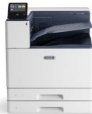
Drukarka kolorowa Xerox® VersaLink® C8000