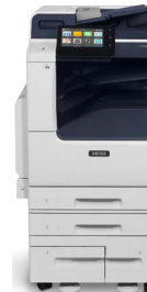
Drukarka wielofunkcyjna Xerox® VersaLink® B7125/B7130/B7135