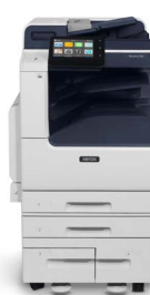
Kolorowa drukarka wielofunkcyjna Xerox® VersaLink® C7120/C7125/C7130