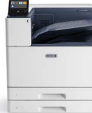
Drukarka kolorowa Xerox® VersaLink® C9000