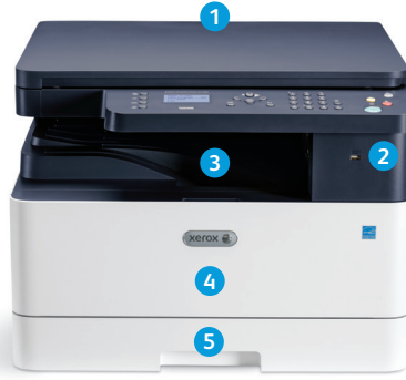
Xerox® B1022 Çok Fonksiyonlu Yazıcı

9 Xerox® B1025, ilave basitlik için daha büyük 4,3 inç renkli dokunmatik ekran arayüze sahiptir.