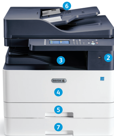
Xerox® B1025 Çok Fonksiyonlu Yazıcı

DADF yapılandırması, isteğe bağlı ilave kaset ile gösterilmiştir.