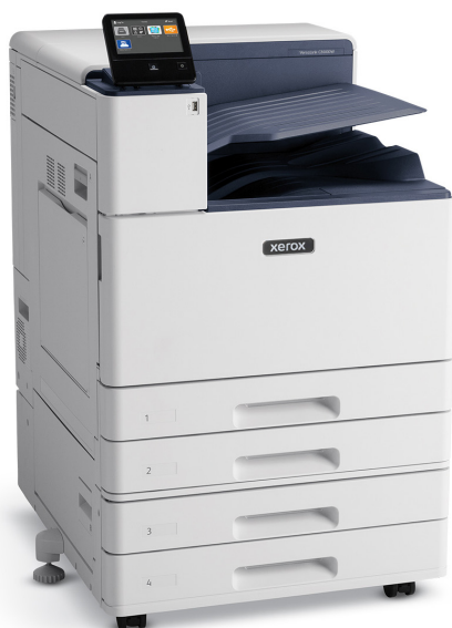
VersaLink® C8000W plus module à deux magasins