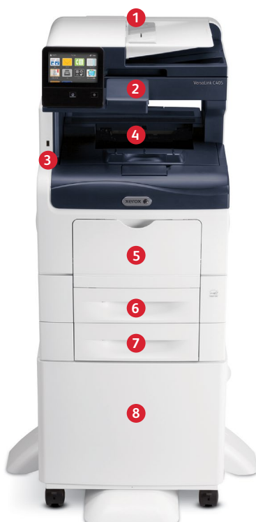
Xerox® VersaLink® C405 Multifunctionele kleurenprinter Print. Kopieer. Scan. Fax. E-mail.