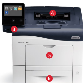
Xerox® VersaLink® C400 Kleurenprinter Print.

1 USB-poorten kunnen worden uitgeschakeld. 2 Alleen voor VersaLink® C405.