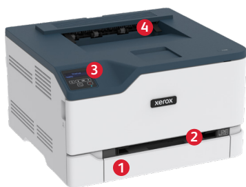
Xerox® C230 färgskrivare