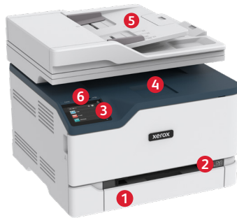
Xerox® C235 Renkli Çok İşlevli Yazıcı