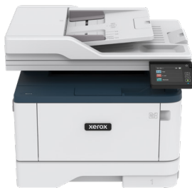
Xerox B315 מדפסת רב תכליתית