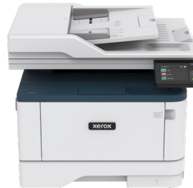
Xerox B305 מדפסת רב תכליתית