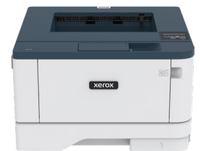
מדפסת B310 של Xerox