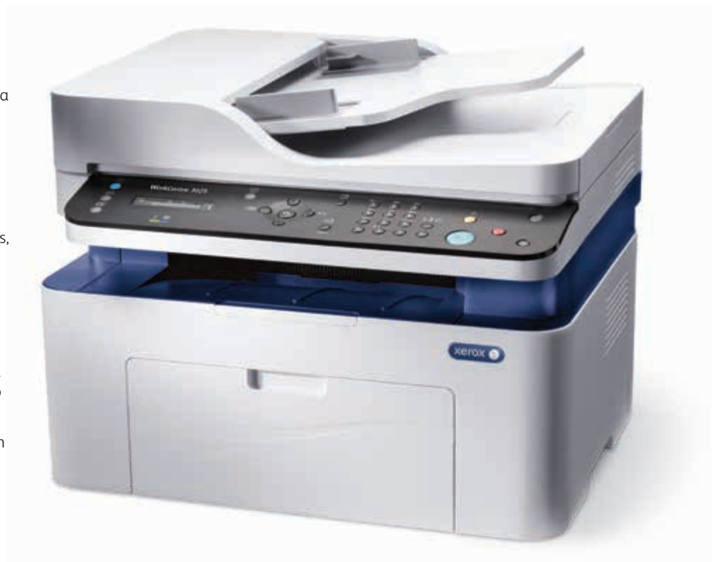
WorkCentre 3025. Copiado. Impresión. Escaneado. Fax.*

* El fax y el ADF están solo disponibles en la WorkCentre 3025NI.