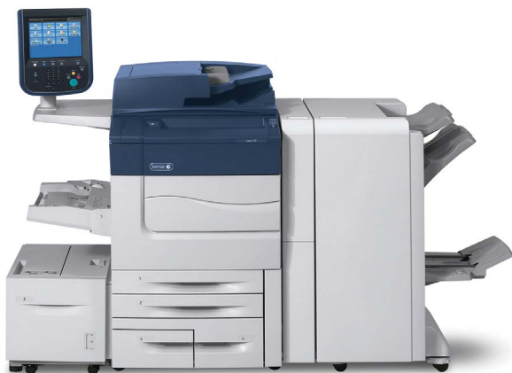
Imprimante couleur Xerox C60/C70