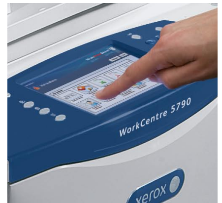
Solutions personnalisées accessibles à partir de l'interface tactile.

Le logiciel ScanFlowStore de Nuance® réduit énormément la durée du traitement des documents grâce à la puissante technologie de reconnaissance optique de caractères. Avec la numérisation basée sur l'utilisation de modèles, un utilisateur peut simplement sélectionner les « zones » sur un document. Les données spécifiques au domaine, comme la santé, le domaine juridique et financier, sont saisies et utilisées pour nommer le fichier, créer des dossiers réseau, charger les options PDF, rechercher, récupérer et acheminer les documents numérisés vers les référentiels appropriés.