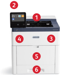
Xerox® VersaLink® C500 -väritulostin Tulostus.