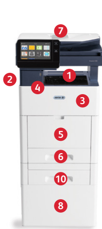
Xerox® VersaLink® C505 -värimonitoimitulostin Tulostus. Kopiointi. Skannaus. Faksi. Sähköposti.