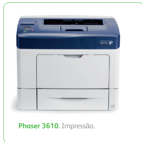
Phaser 3610. Impressão.